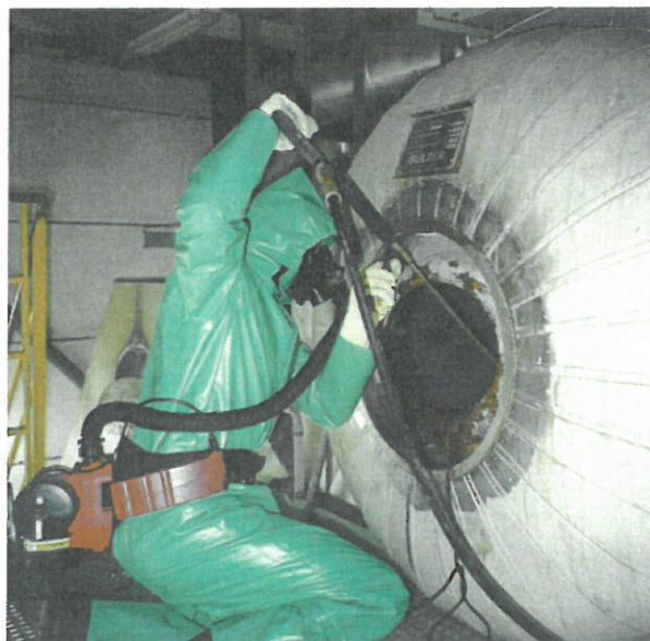
Arbeiten am Verbrennungssofen der Novartis AG, Basel. Giftristentfernung

Industriereinigung und Wartung als Qualitäts- und Sicherheitsfaktor – ist unsere Mission. Wenn es gilt die Gesundheit zu schützen, können Sie sich auf Studer Clean verlassen. Damit das Risiko keine Chancen hat.